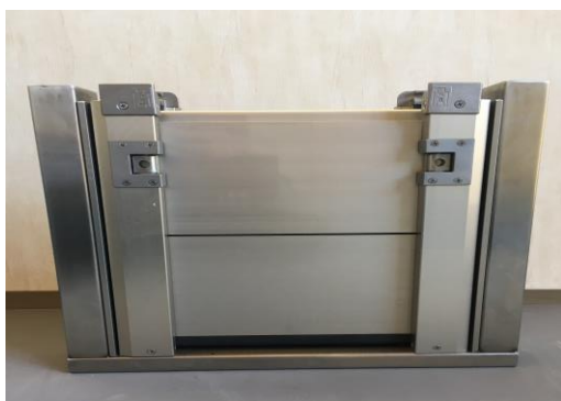
2.止水パネルを順番に注意して入れます

通常時はカバーの中に セーフティーロック専用金具 を収納できるので無くす心配 がありません