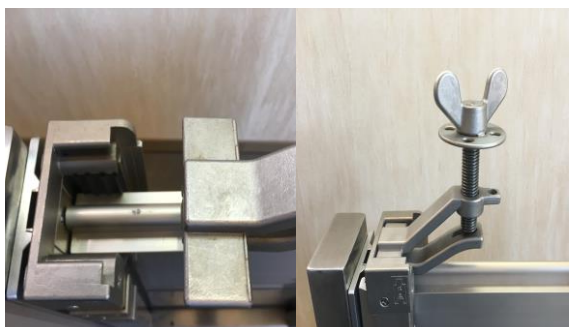
4.抑え金具をいれ、上部を回し固定します ※設置後漏水があるときは、さらに回わし調整してください