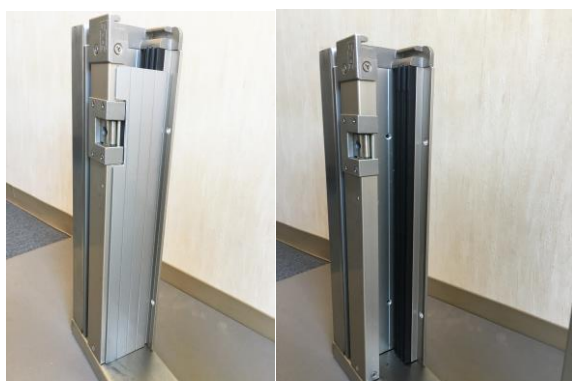
1.両側のレールのカバーを外します