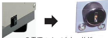
◎電源スイッチをキー仕様へ

※「穿孔(穴あけ)枚数」及び「綴じ枚数」は、PPC64g/m 2 用紙での最大枚数の目安となります。