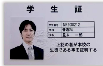
● 学生証の写真割印