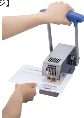
ハンドルは、片手でも両手でもご利用できます