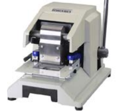
手動タイプ10枚契印 MODEL 26NF