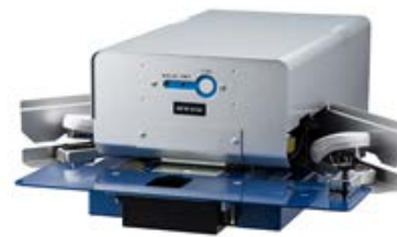
電動タイプ18枚契印 MODEL PEF-18