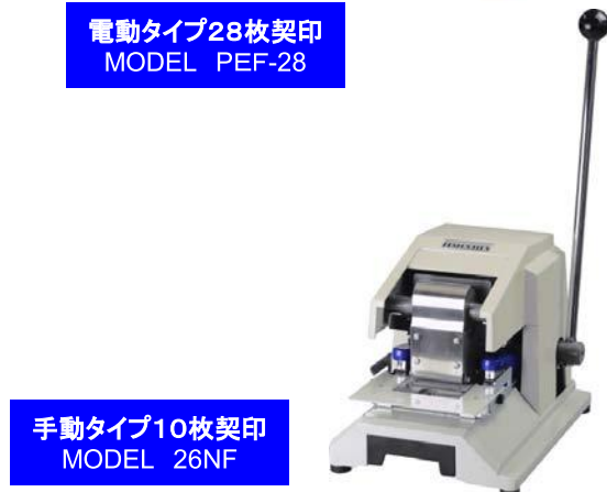
手動タイプ10枚契印 MODEL 26NF