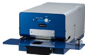
電動タイプ28枚契印 MODEL PEF-28