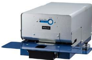
電動タイプ18枚契印 MODEL PEF-18