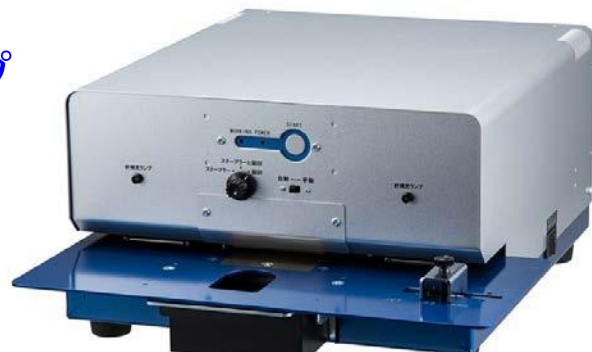
電動タイプ 32枚契印 MODEL PEF-32