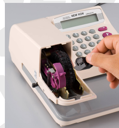
インクロー交換は専用インクユニットで!