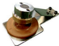
手動式印面ブロック