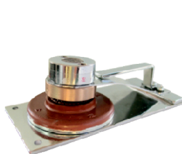
電動式印面ブロック