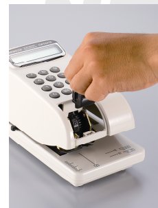
インクロー交換は専用インクカートで！