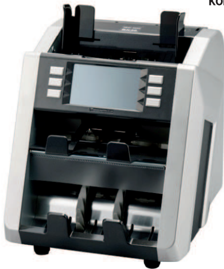
KON MODEL BN16A