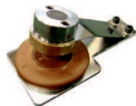
印面ブロック(手動用)

このカタログについてのお問い合わせや見積もりは、お近くの販売店にご相談ください。その他ご不明点がありましたら、直接弊社までお問い合わせください。