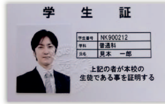
● 学生証の写真割印