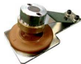
印面ブロック(手動用)