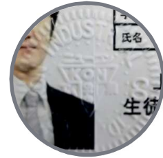
● 割印部のイメージ図