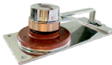
印面ブロック(電動用)