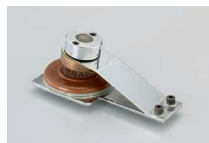
印面ブロック(手動用)