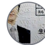
割印部のイメージ図