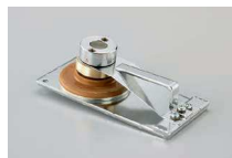
印面ブロック(電動用)