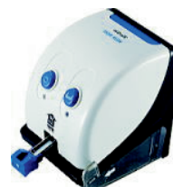
※ステープラー針の充填