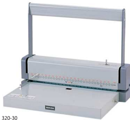
320-30 税抜価格 ¥53,000