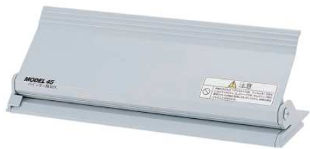
45/46 税抜価格 ¥23,100