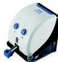
※ステープラー針の充填