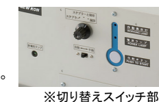
※切り替えスイッチ部

「契印(穴あけ)枚数」及び「綴り枚数」は、PPC64g/m 2 用紙での最大枚数の目安となります。