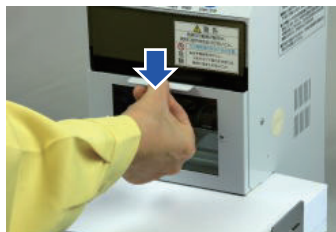
カバーをおろす (カバーをおろさないと穿孔しない安全設計)