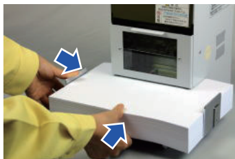
センターゲージで揃える