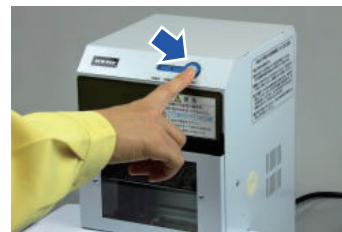
スタートボタンを押す(穿孔)