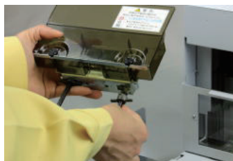
工具不要で簡単な刃の交換