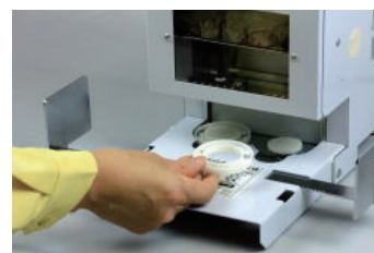
刃先からこぼれたカス掃除も簡単な カストレイ(PAT.PEND)