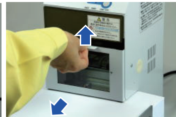
カバーを上げ取出す