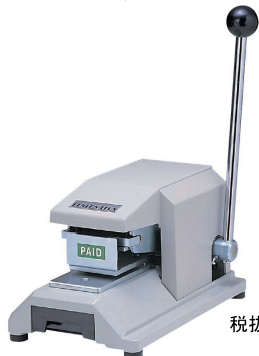
KON MODEL 206CC (PAID/VOID)