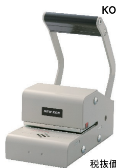
KON MODEL PR-10 (PAID/VOID)