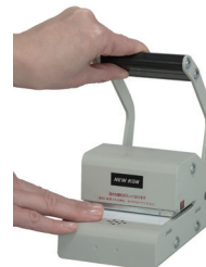
穿孔はハンドルを下に