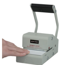
磁気抹消は奥にスライド