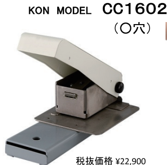
KON MODEL CC1602 (O穴)