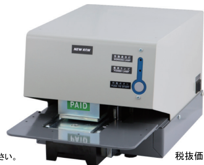
KON MODEL 103CC (PAID/VOID)