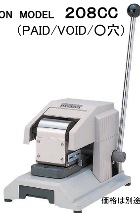
KON MODEL 208CC (PAID/VOID/O穴)