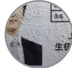
割印部のイメージ図