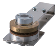
印面ブロック(手動用) EML-110用