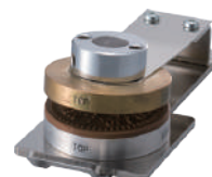
印面ブロック(電動用) EEL-70用