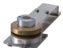
印面ブロック(電動用) EEL-110用