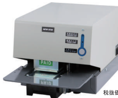
KON MODEL 103CC (PAID/VOID)