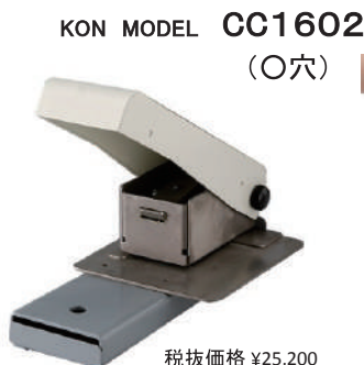
KON MODEL CC1602 (O孔)