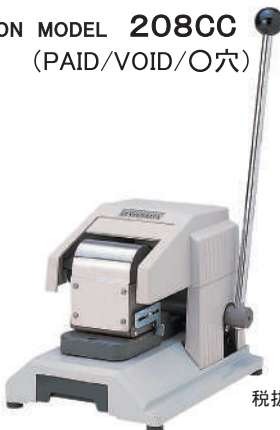
KON MODEL 208CC (PAID/VOID/O孔)