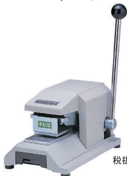
KON MODEL 206CC (PAID/VOID)