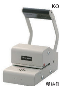
KON MODEL PR-10 (PAID/VOID)