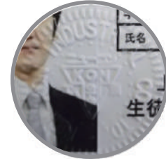
割印部のイメージ図