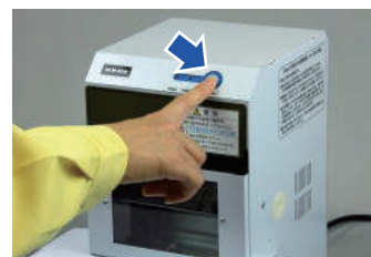
スタートボタンを押す(穿孔)