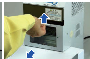
カバーを上げ取出す