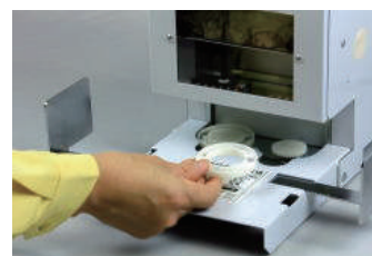
刃先からこぼれたカス掃除も簡単な カストレイ(PAT.PEND)