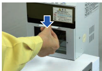
カバーをおろす (カバーをおろさないと穿孔しない安全設計)