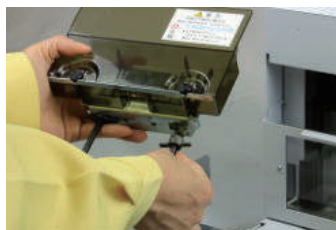
工具不要で簡単な刃の交換