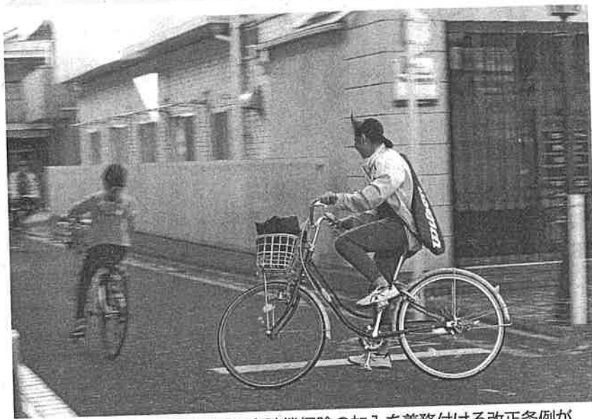
自転車を利用する都民に損害賠償保険の加入を義務付ける改正条例が施行された。加入率はアップするか 一 世田谷区

自転車の安全で適正な利用の促進に関する条例を改正。これまで努力義務だった保険への加入を自転車利用者本人やその保護者に対して義務化する。ただ、義務違反に対する罰則などは盛り込まれていない。自転車小売業者に対しては努力義務として、自転車購入者への保険加入の有無などの確認や保険に関する情報提供の実施を求めている。