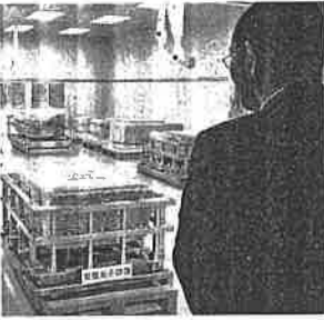
取り出された壁画が置かれ=1月、奈良県明日香村

長く古墳の石室内にあったしっくい層は性質が変化した。実験室で完全に再現するのは困難だった。「実際の状態を熟知した技術者が、これは 修復は終わりの、土台にあたるもろくなっている必要がある。新たな施設について具所や展示方法はなおらず、搬送なら