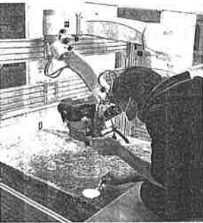
壁画の修復作業=奈村(文化庁提供)