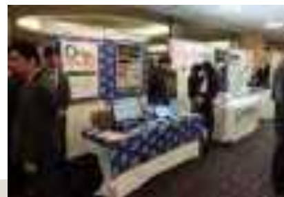
自社製品の展示の様子