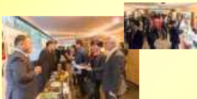
商品・見本品の展示を通して自由に 名刺交換等の商談機会を提供いたします。

申込企業数：2,035社 ホスト企業面談数：1,799社 来場社間面談数：3,748回