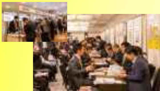
事前予約なしで参加企業が希望される ホスト企業との面談を当日提供します。