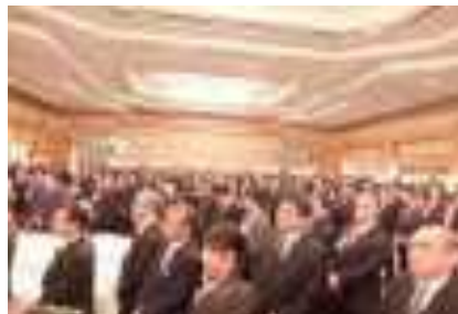
メインホール セレモニーの様子