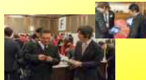
位置探索システムを活用し、面談希望来場社の 現在地を特定し会場内でお引き合わせします。