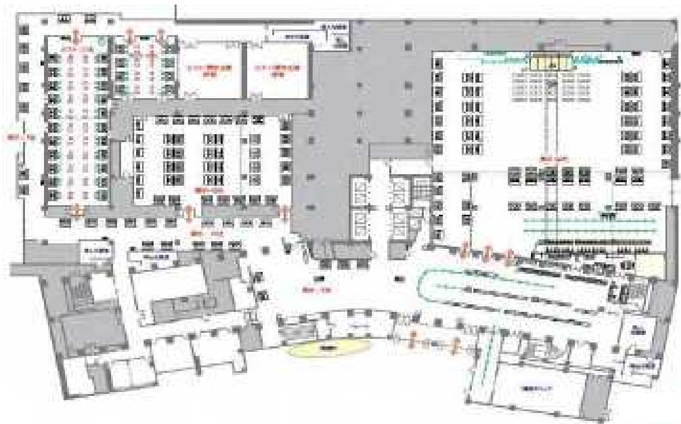
【ホスト企業ブース】