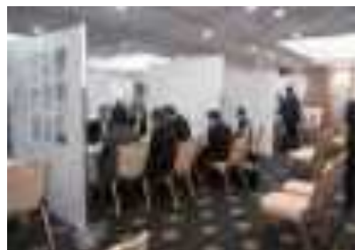
来場社様との面談の様子