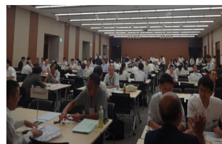
令和元年度商談会の様子。 発注・受注延べ150社の企業の方にご参加いただきました